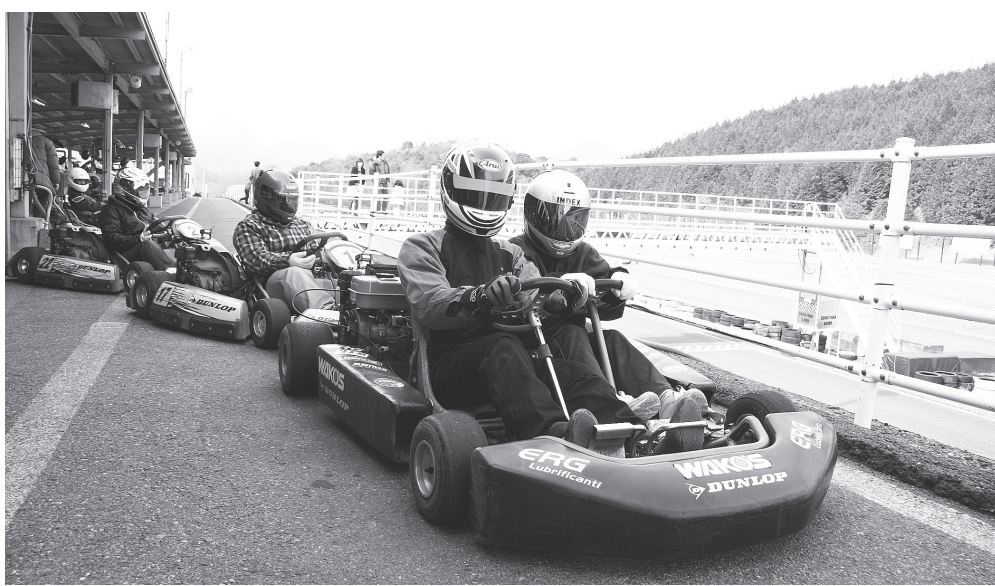
レンタルカートは運転免許があれば簡単な説明を受けるだけで走行可能。GPには参加できないが、2人乗りのカートもある