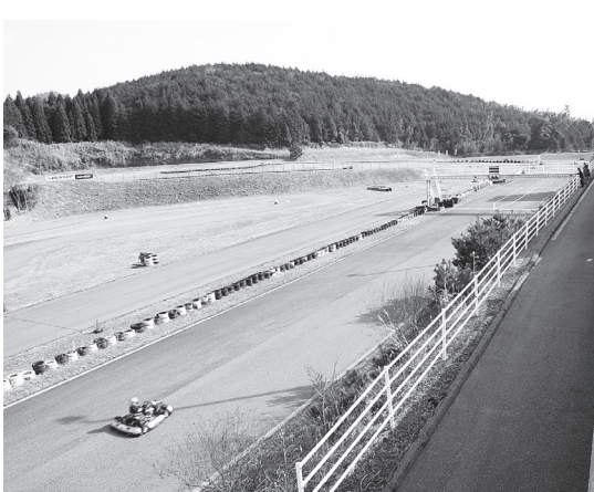
九州最長級、1080mのロングコースが魅力のソニックパーク安心院。高低差は6mある

G（横加速度）を感じる。乗用車で感じるのはいせいの0.5～0.8G程度とされるが、カートでは2G以上感じることもある。視線が低いと、体感時速は約3倍にいわれる。