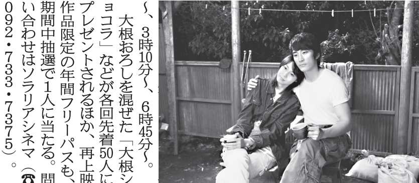
大根おろしを混ぜた「大根シヨコラ」などが各回先着50人にプレゼントされるほか、再上映作品限定の年間フリーパスも、期間中抽選で1人に当たる。問い合わせはソラリアシネマ（092・733・7375）。